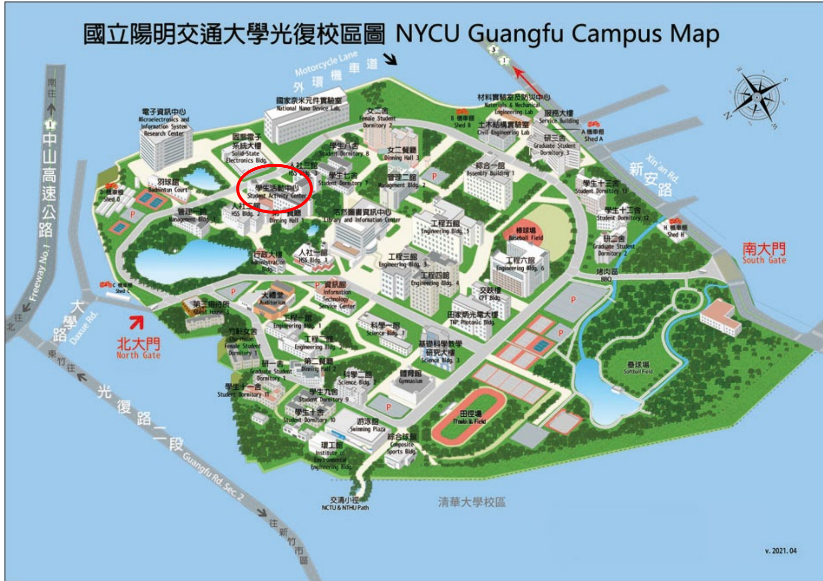
光復校區平面圖(紅圈處為學生活動中心位置)