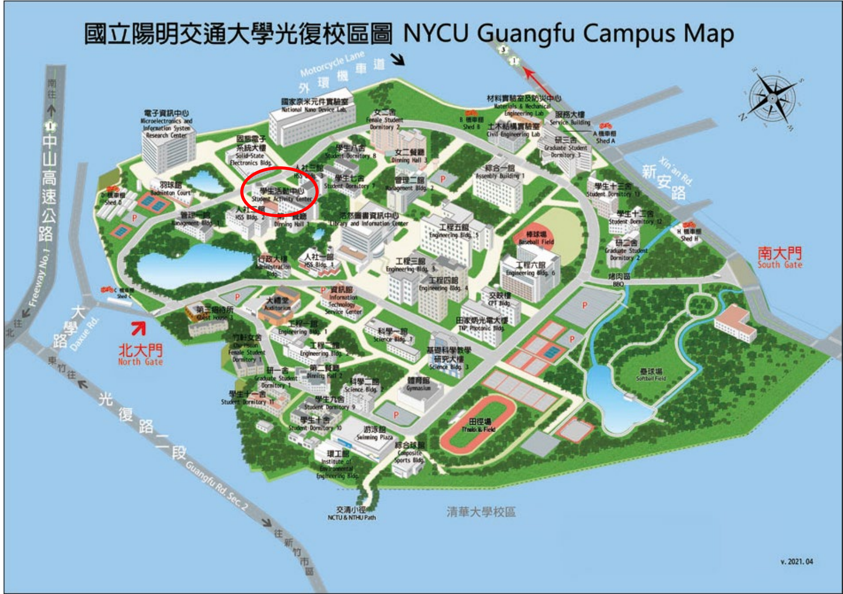
光復校區平面圖(紅圈處為學生活動中心位置)